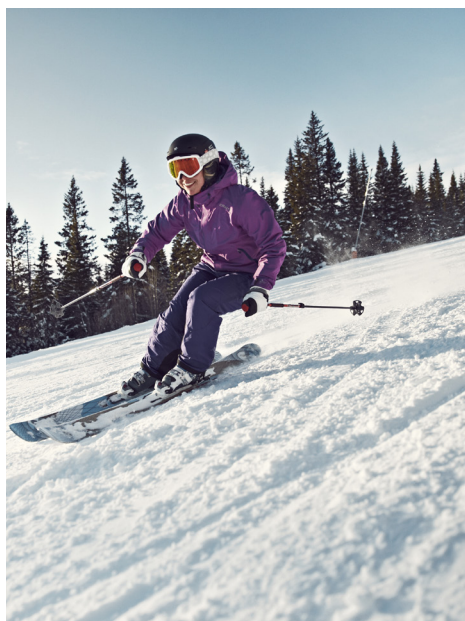
Framsidedbild från varumärket Craft.