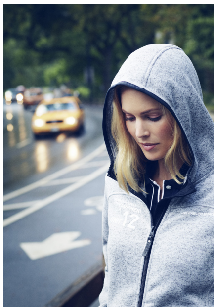
Framsidedbild från varumärket Harvest.