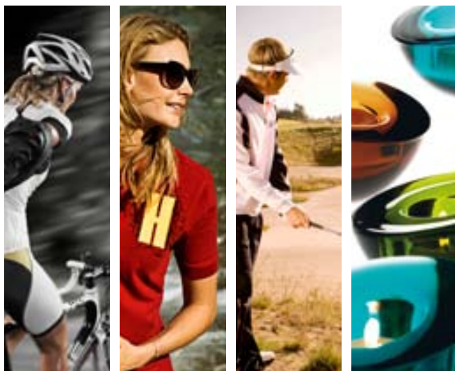
Bilder från Craft, Grizzly, Cutter & Buck, och Orrefors.