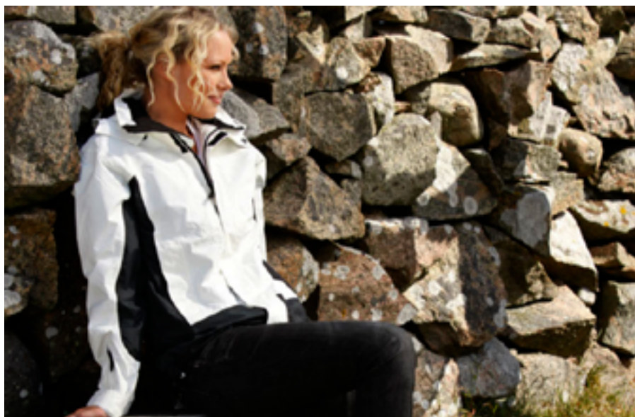
Clique promowear jacket Babson.