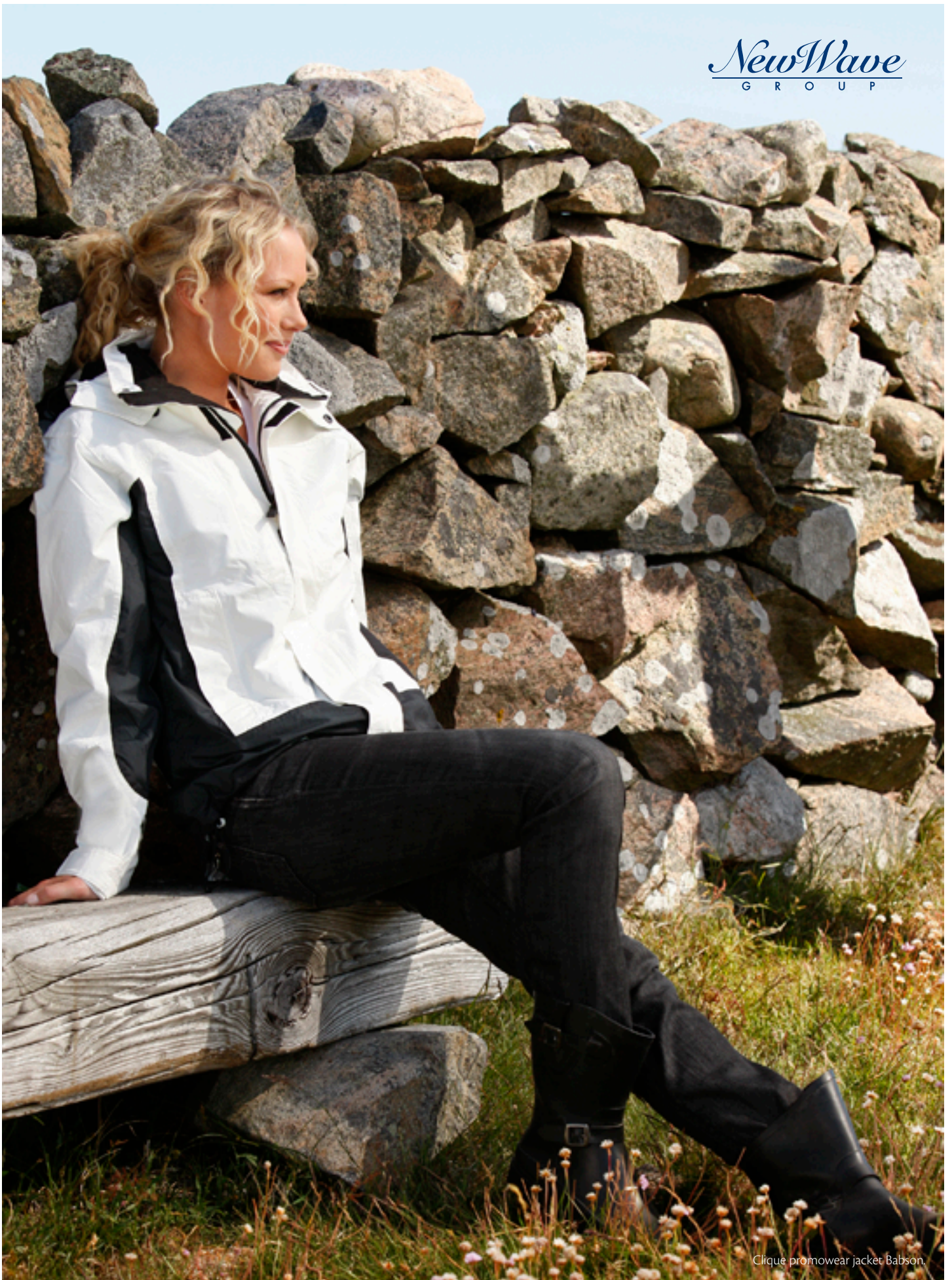
Clique promowear jacket Babson.